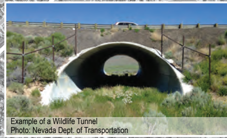
Example of a Wildlife Tunnel

Este mapa demuestra donde 1,058 casas serían construidas - ubicado entre dos parques regionales que no se podrían comunicar sin preservación. Use la leyenda abajo para ubicar atributos y beneficios propuestos si esta tierra fuera preservada en lugar de construida.