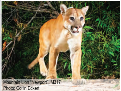
Mountain Lion "Newport", M317

Zonas verdes (hábitat restaurado e irrigado que sirve como protección de incendios) Advertencia: Todo lo demostrado aquí es conceptual y sujeto a revisiones.