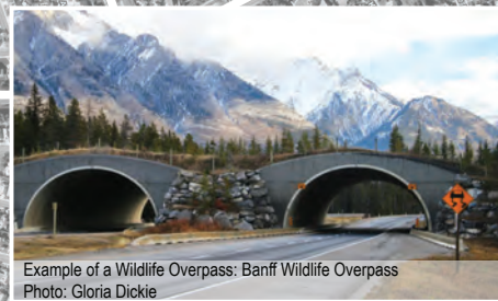
Example of a Wildlife Overpass: Banff Wildlife Overpass