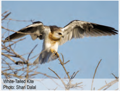
White-Tailed Kite